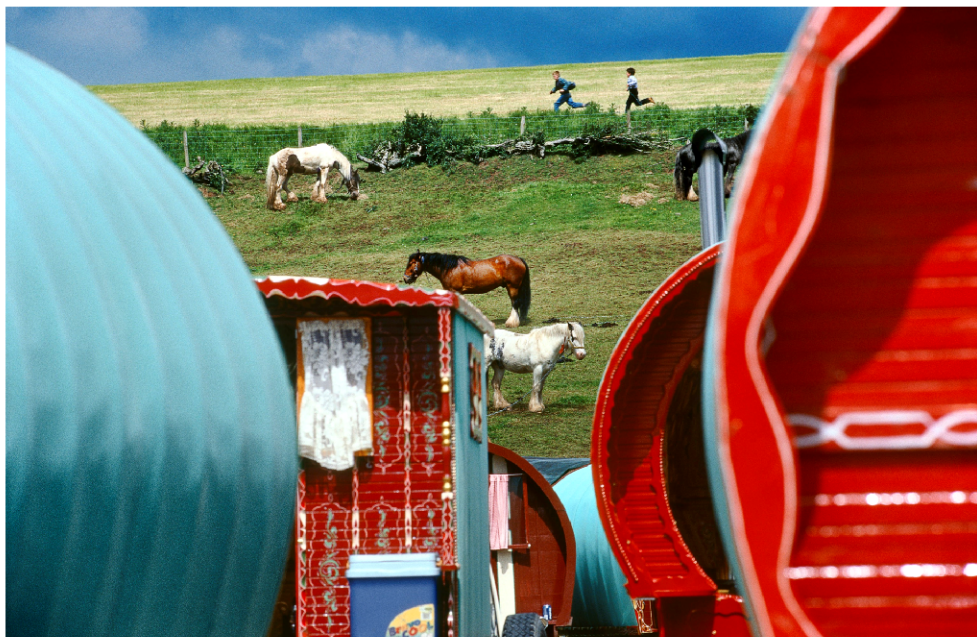
Cikánské osady v Anglii

Několik snímků na toto téma vzniklo v Polsku, kde je velmi obtížné navázat kontakt s rumunskými Romy, kteří sem přijíždějí hledat jednodušší způsob života. Aby je mohl fotografovat v běžných životních situacích, Tomaszewski se spřátelil s jednou skupinou z Varšavy, která v té době prožívala smrt malého chlapce.