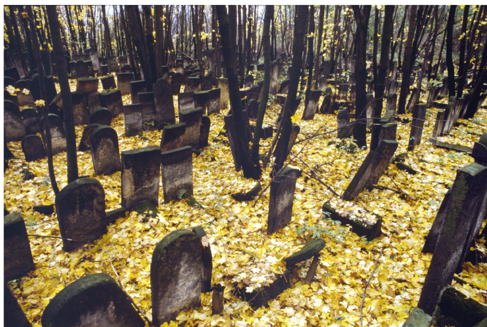
Židovský hřbitov ve Varšavě, Polsko.

Všechno proběhlo poměrně hladce, Američané z televizní stanice se spolupráci nebránili, ba naopak koupili Tomaszewskému letenku do New Yorku. Na schůzce s vydavatelem dostal kontrakt, ale jelikož jeho znalost angličtiny byla na nule, se slovníkem v ruce překládal 15 stran právníkem psané smlouvy. V několika bodech se mu smlouva nelíbila a místy se mu zdála nepoctivá až nebezpečná, takže vznesl několik námitek, což na druhou stranu udělalo dobrý dojem. Nakonec požádal o zálohu, protože mu chyběly peníze na dokončení celého projektu. Se členy vydavatelství šli do banky, kde mu bylo vyplaceno 2000,- dolarů. K jejich velkému překvapení je dal jednoduše do kapsy a z banky odešel. Mysleli si o něm, že je šílený, protože ve Státech nikdo nechodí s tolika penězi jen tak v kapse. Díky těmto prostředkům mohl ze své cesty přivést domů nějaké filmy, chemické látky a fotografický papír na zvětšení snímků. Za tři měsíce se vydavatelé rozhodli navštívit Polsko a ujistit se, že to není podvod, ale že tento fotograf opravdu existuje a pracuje na knize, že neleží někde na vesnici pod stromem a nepije whisky. Návštěva je ale přesvědčila o opaku a ještě více se začali projektem zabývat. Viděli také, že se práce už pomalu chýlí ke konci.