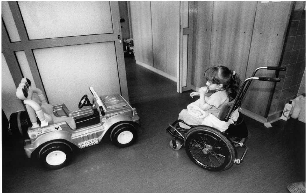
Centrum Zdrowia Dziecka (Centra zdraví dítěte), Varšava, Polsko.

Ředitel splnil svůj slib a nijak do přípravy nezasahoval. Autor si knihu sám cenzuroval a vytáhl 3 snímky, které byly příliš intimní na to, aby byly určeny široké veřejnosti.