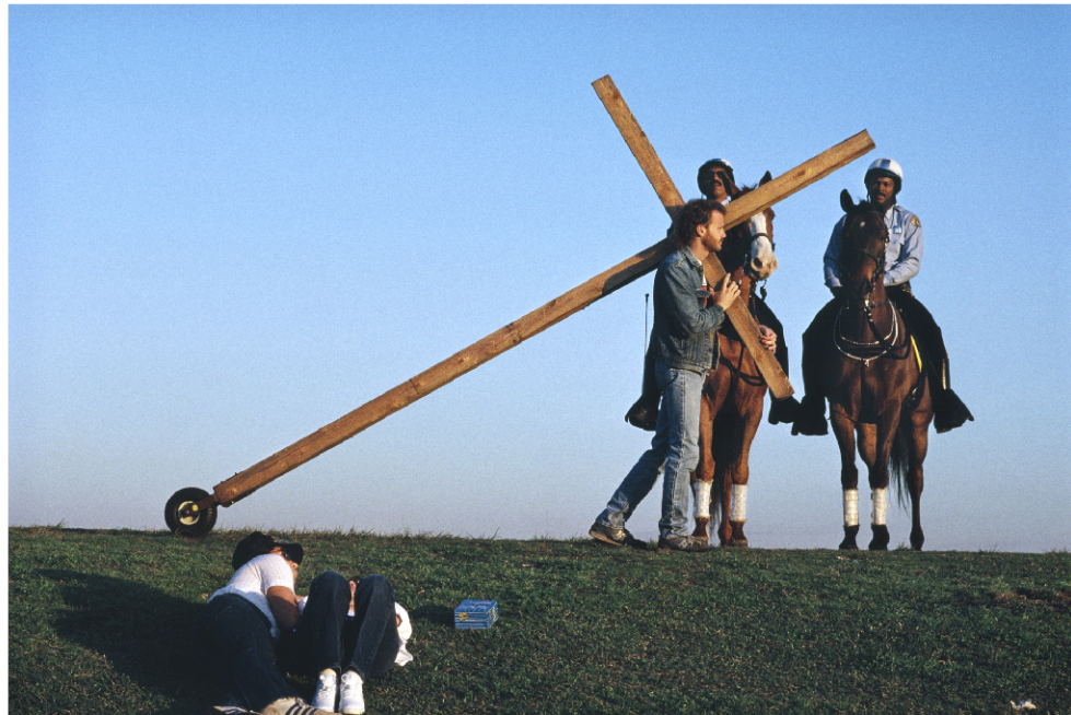
Muž s křížem, New Orleans, USA.

Gazeta Wyborcza Poznań č. 19, 23. 1. 1999