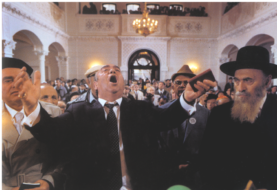
Synagoga Nożyka ve Varšavě, Polsko.