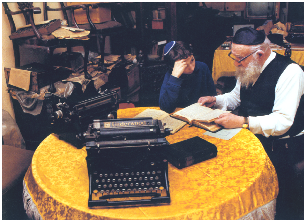
Mojšesz a Mateusz během výuky náboženství u učitele doma, Polsko.

Kos, chlapec, který měl po válce v Polsku první „ Bar micvu “ (proces zasvěcení mladých hochů do židovské víry). Ten je nyní rabínem.