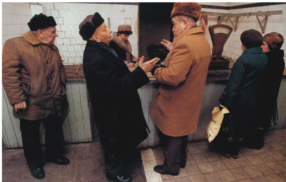
Obchod s košer masem, zřízený v bývalé místnosti určené k rituální lázni, Polsko.