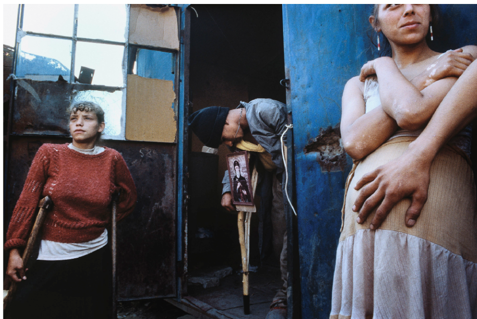
Žebrácké městečko, Bukurešť, Rumunsko

Na projekt dostal stanovený čas, který nesměl překročit. Když tak přemýšlel o zemích, které chce pro focení navštívit, zjistil, že má na každý stát 10 dní. Není to moc dlouho, 10 zemí za 10 týdnů, možná to není až tak tragické v případě České republiky nebo Slovenska, ale problém je třeba s takovou Francií nebo Španělskem a hotovou katastrofou v případě Indie.