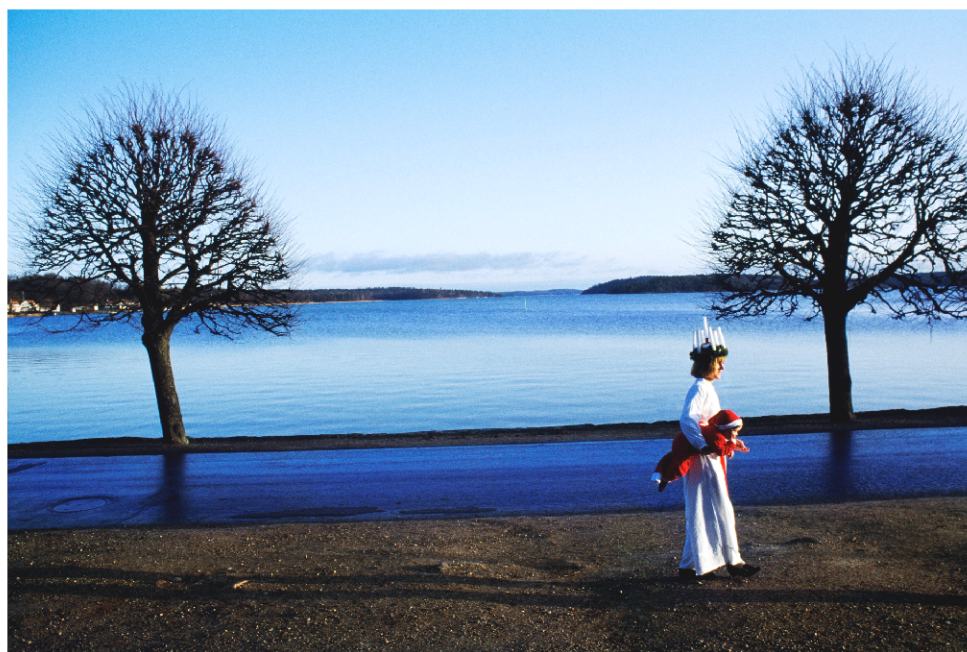
Den sv. Lucie, Švédsko

V roce 1999 připravoval Tomaszewski reportáž o Švédsku. Myslel na atraktivitu sbíraného materiálu, a proto se snažil fotit tak, aby bylo možno z každé záležitosti vytvořit dílčí příběh. Tak vznikaly rozsáhlé eseje o velkých lodích – trajektech coby plovoucích městech, přístavech, loděnicích. Vědom si vztahu Švédů k odpadkům, rozhodl se navštívit smetiště a podívat se, jak s odpady nakládají. Velmi rád využíval privilegia, která mu přinášela novinářská průkazka NG . Mohl si tak dovolit zavolat kapitánovi lodi a požádat ho, aby zpomalil loď při projíždění kolem malého ostrůvku, aby se mu tak lépe povedlo místo vyfotit. Kapitán mu velmi rád vyhověl a pomohl mu. Za nějaký čas zjistil, že materiál, o kterém si myslel, že je bezvýznamný, byl často využíván mnoha listy, protože svět velmi zajímalo vše o Švédsku a agentura Visum, která ho zastupovala, chtěla další a další fotografie.