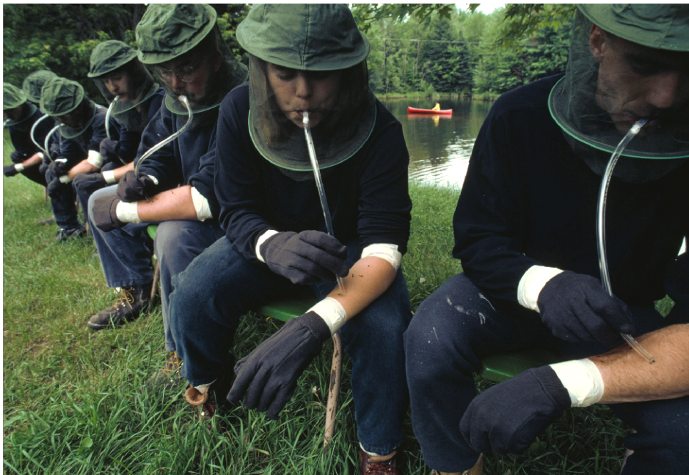
studenti chytající komáry pro vědecké účely - řeka sv. Vavřince, Kanada

Tomaszewski se na každou svoji cestu připravuje asi tři roky. Studuje různé dostupné novinové články v polštině i v angličtině, ale většinou ve chvíli, kdy dorazí na místo, zjistí, že realita se od článků úplně liší.