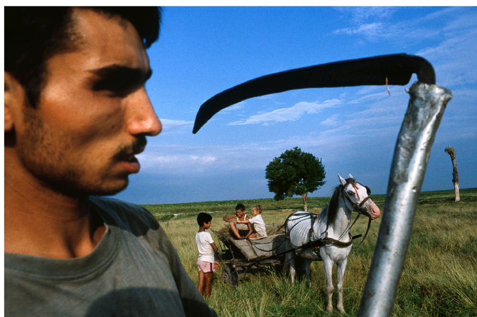
Rumunský zemědělec během senoseče

Autor se celou dobu domnívá, že je to poměrně důležitý materiál, ale také si myslí, že pouhým opublikováním v magazínu NG spolu s malou výstavou vybraných prací, nebyl dost dobře využitý. Jeho ideou byla velká putující výstava, kterou by přemísťovali z místa na místo a která by upozorňovala hlavně mládež na problém rasismu a netolerance, kterých je všude kolem ještě stále hodně. Jeho přáním bylo, aby k této výstavě byl vydán i katalog, který by byl zdarma rozdávan, ale nikdo z možných sponzorů nechtěl mít nic společného s romskou záležitostí.