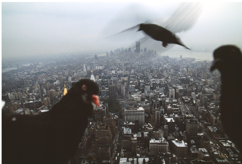
Panoráma New Yorku s výhledem na Manhattan , USA.