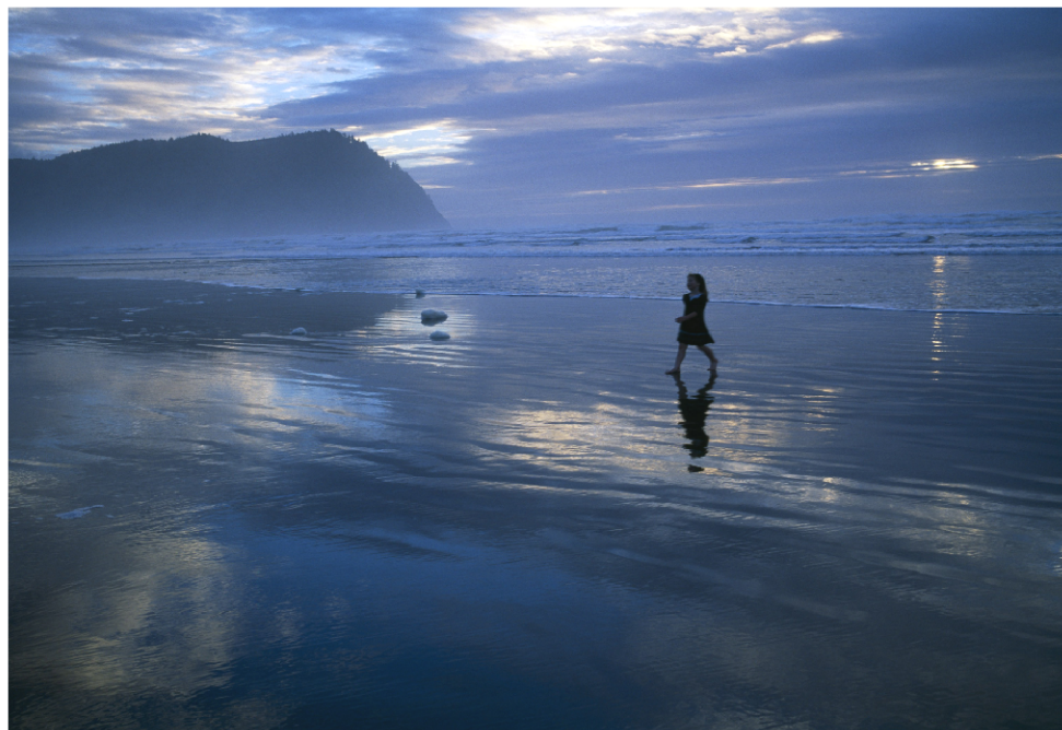
Holčička procházející se po pláži - Louisiana, USA.

Rozhovor autora s Tomaszem Tomaszewskim ze dne 2. 9. 2005