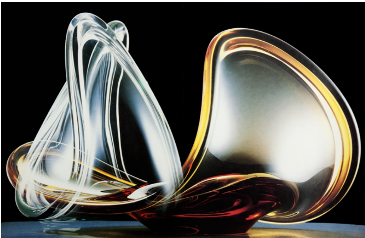
obr. 3 Miroslav Vojtěchovský: fotografie skla