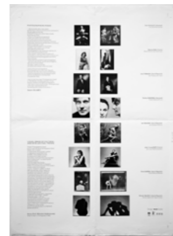
obr. 16, 17 obě strany plakátu k výstavě FAMU, Photokina , 1996