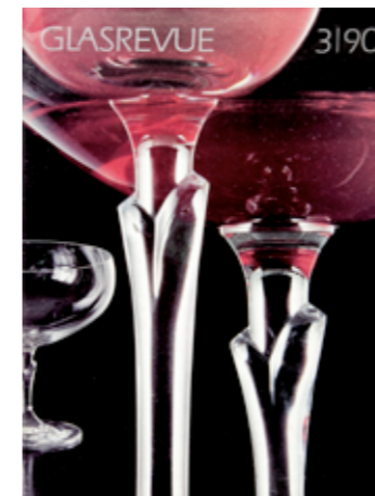
obr. 8, 9, 10 Miroslav Vojtěchovský: obálky časopisu GLASS REVIEW , 1989, 1990