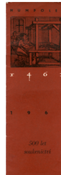
obr. 4 obálka katalogu k výstavě Humpolec 1461–1961, 500 let soukenictví, 1961