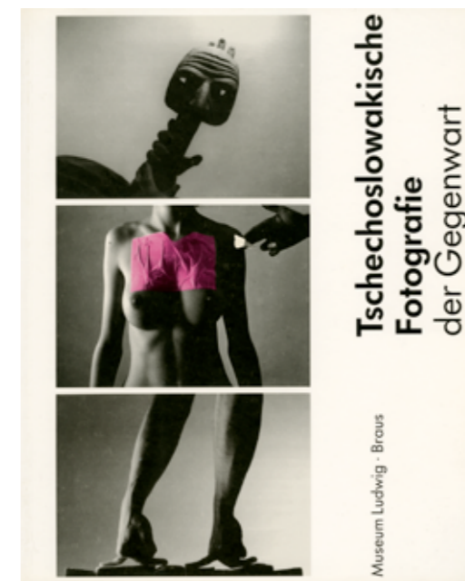
obr. 19, 20 obálka katalogu k výstavě Tschechoslowakische Fotografie der Gegenwart, 1998

Tato výstava byla po Praze představena také v Domě umění města Brna od 28. ledna do 25. února 1997, v Galerii výtvarného umění v Karlových Varech jako oficiální akce filmového festivalu, v umělecké besedě slovenské a to v rámci Měsíce fotografie v Bratislavě v listopadu 1997, dále v Berlíně, v menší variantě i v jiných městech. Výrazně inovovaná a rozšířená verze této expozice byla pod názvem Česká fotografie 90. let (Czech