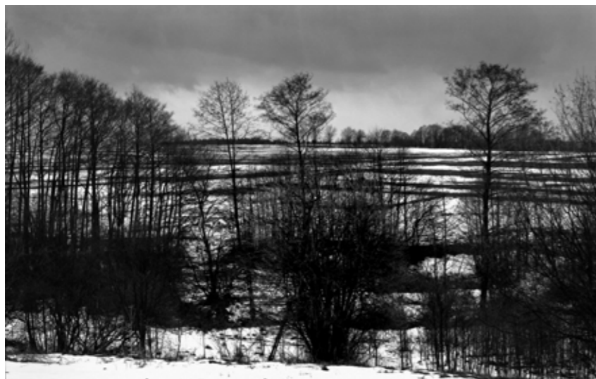
obr. 2 Miroslav Vojtěchovský: krajina u Nasavrky

Rodinné zázemí darovalo Miroslavu Vojtěchovskému vztah k umění, k teologii a filozofii. Praktická stránka jeho osobnosti prahla po nalézání vztahů a řádu v okolním světě, kladení otázek a hledání odpovědí, objevování smyslu lidské existence. Osudové setkání namířilo jeho snahy a touhy především do oboru fotografie.