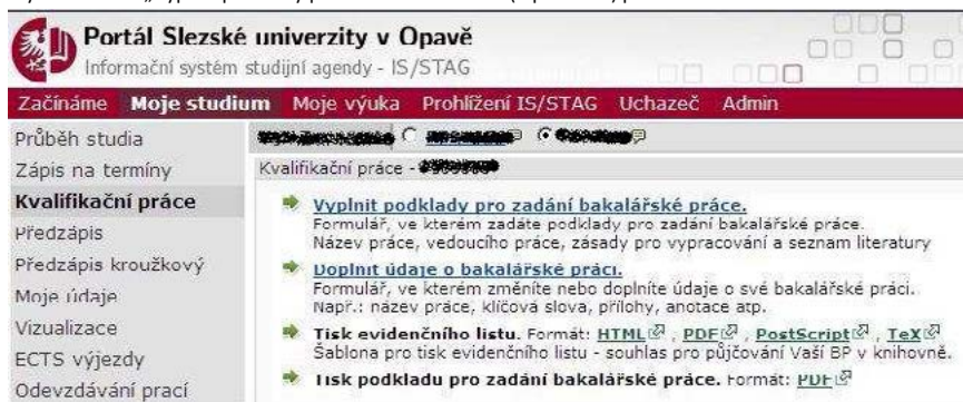
Obrázek 2-Odkazy na vyplnění podkladů práce