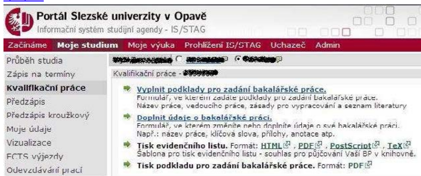
Obrázek 1-Výřez úvodní obrazovky http://stag.slu.cz