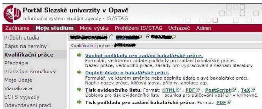
Obrázek 6-Odkaz na doplnění údajů o DP/BP/RIGP/DISP studentem

Nyní má student čas na vypracování práce. Veškeré změny v podkladech zadání konzultuje s vedoucím práce a po schválení změn vedoucím provede příslušné opravy na webu. Kdykoliv během zpracování práce, nejpozději však týden před jejím odevzdáním musí student vyplnit na portále formulář „Doplnit údaje o bakalářské (diplomové) práci“.