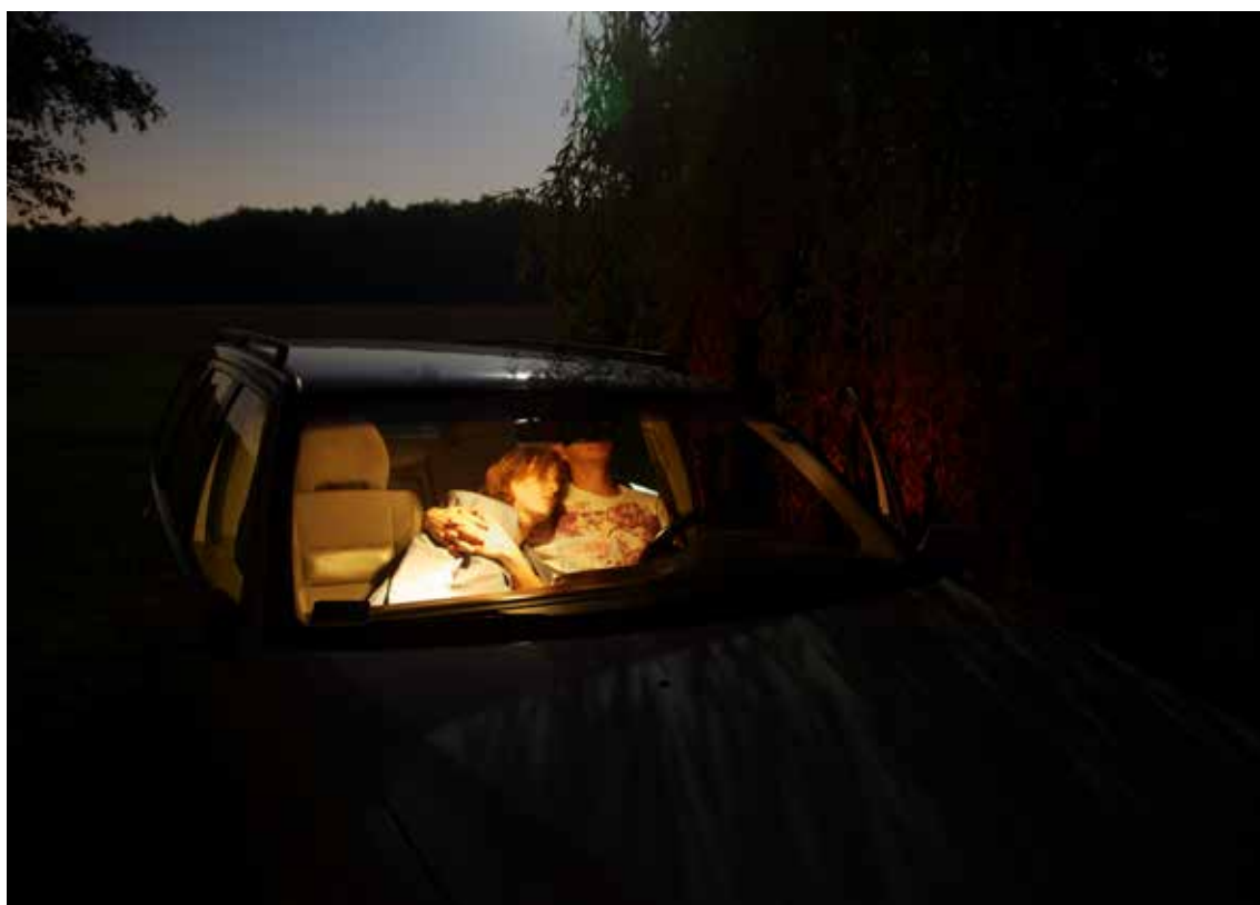
Magda Sokalska od I've Seen Some Signs of Love série