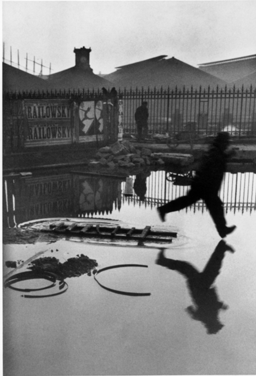
Henri Cartier - Bresson