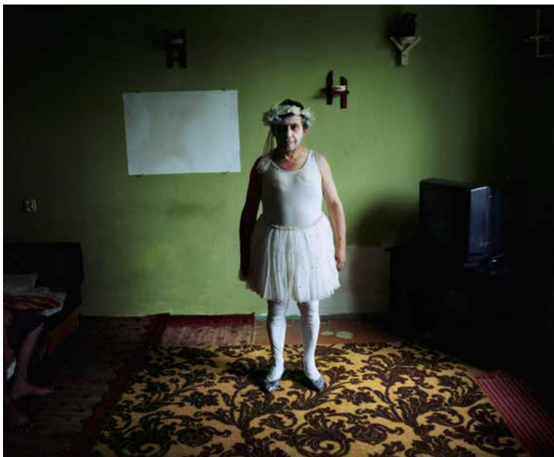
Rafal Milach, od Mizející cirkus série