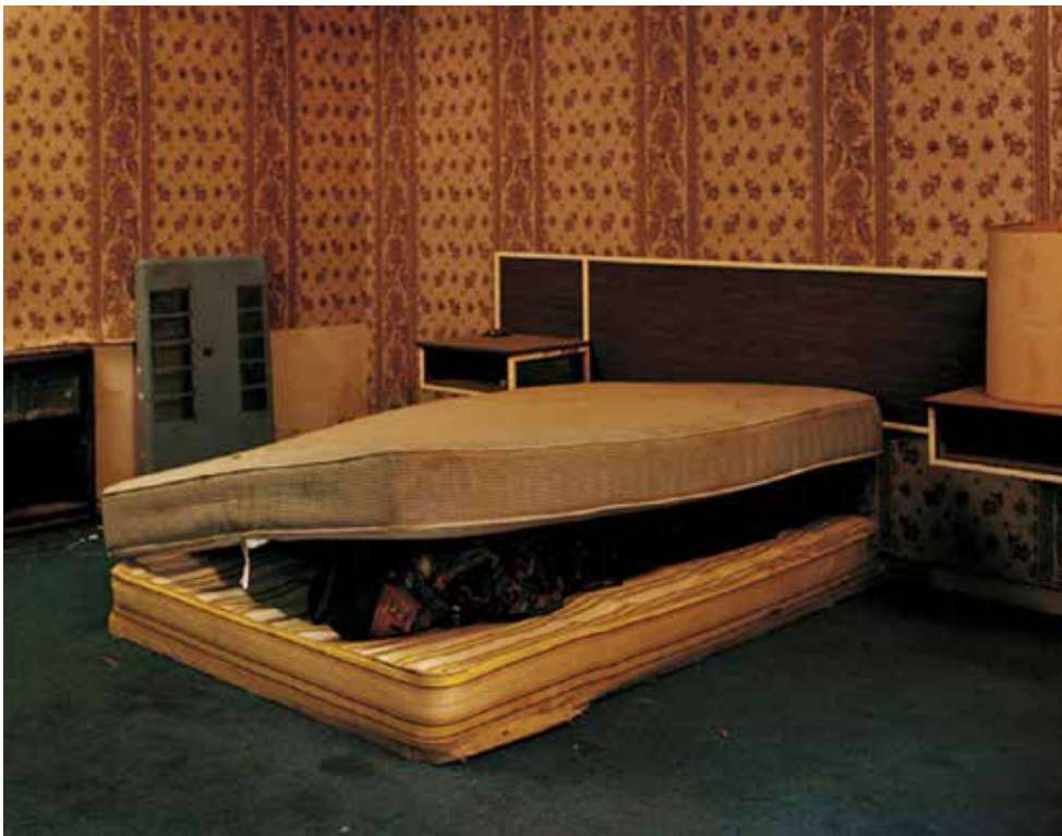
Taryn Simon, od Innocence série