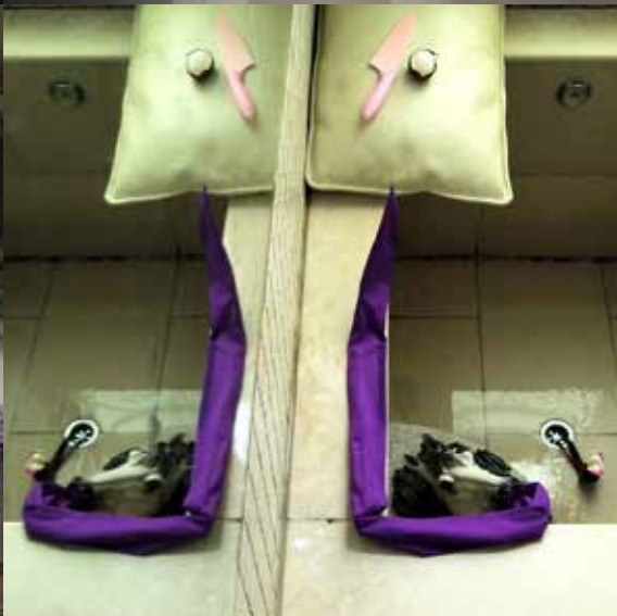
Filip Berendt od Návštěva série