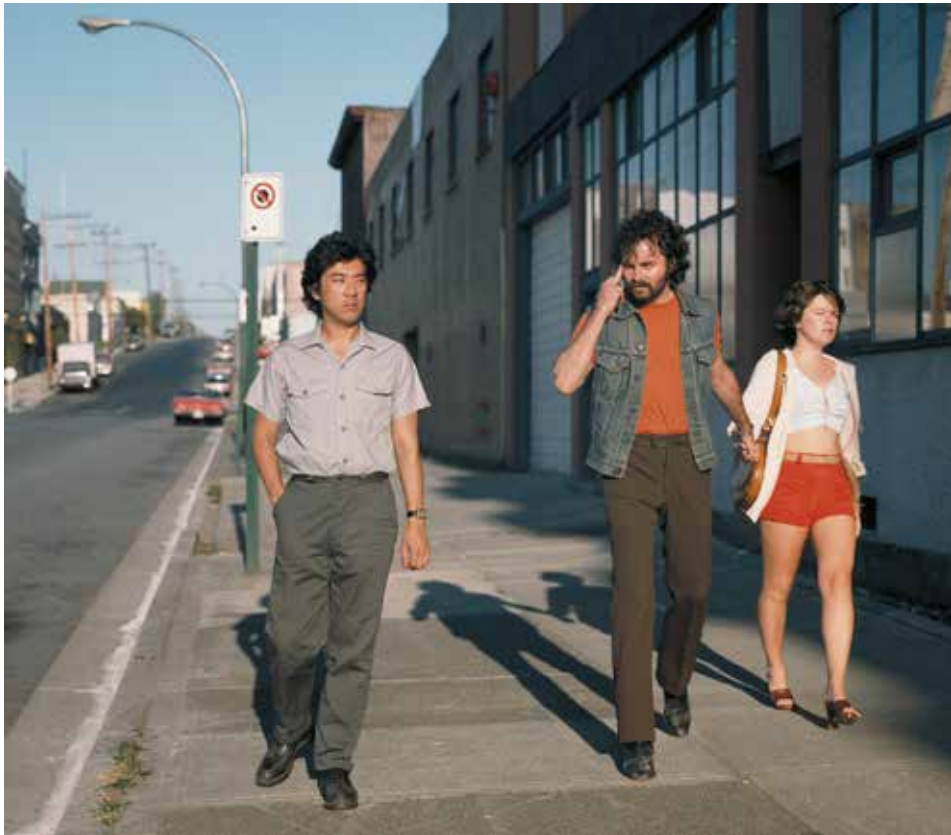
Jeff Wall, Mimic