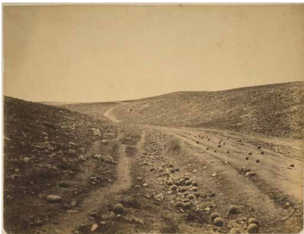
Roger Fenton, Údolí stínu smrti