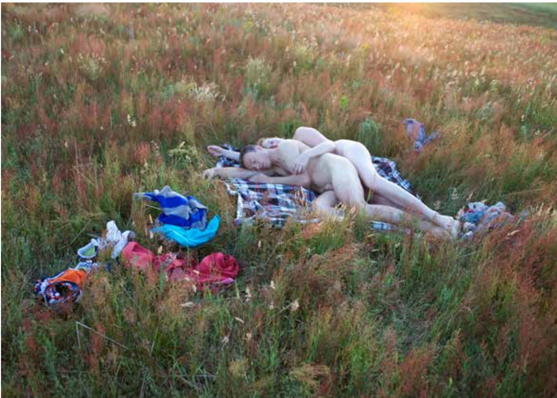
Magda Sokalska od I've Seen Some Signs of Love série