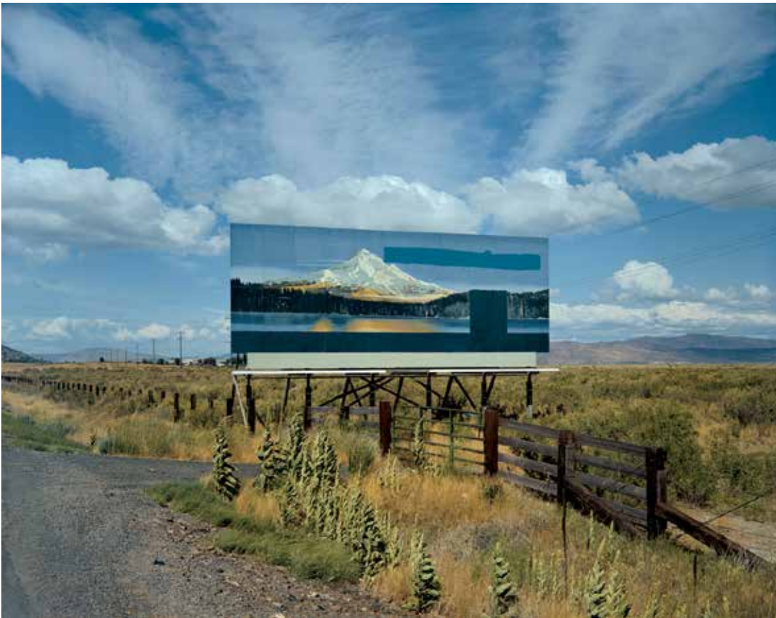
Stephen Shore, od Uncomon Places série