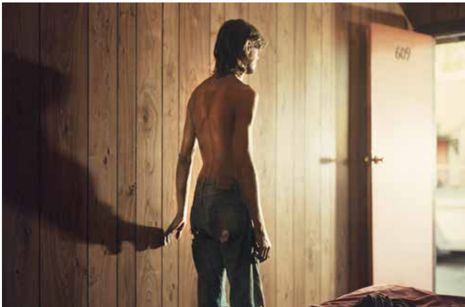
Philip - Lorca diCorcia, od Hustlers série