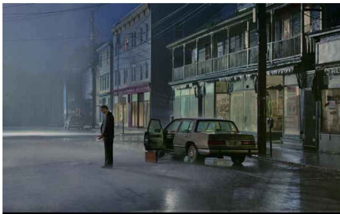
Gregory Crewdson, od Beneath the Roses série