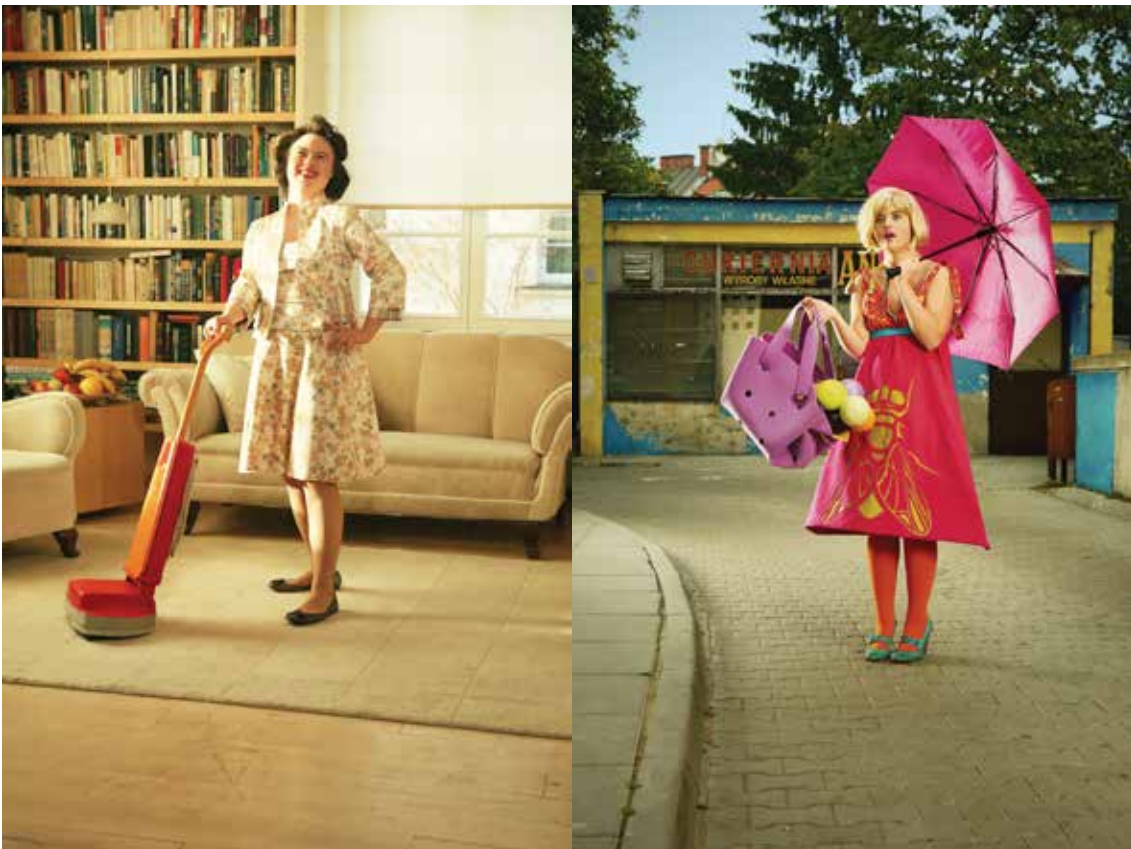
Oiko Petersen od Downtown série